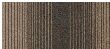
Modelo: FIRST WAVES 123