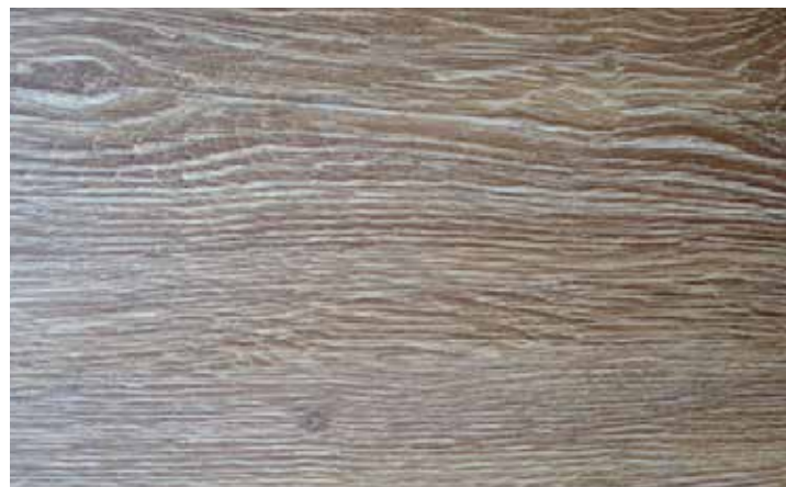
Modelo : Roble