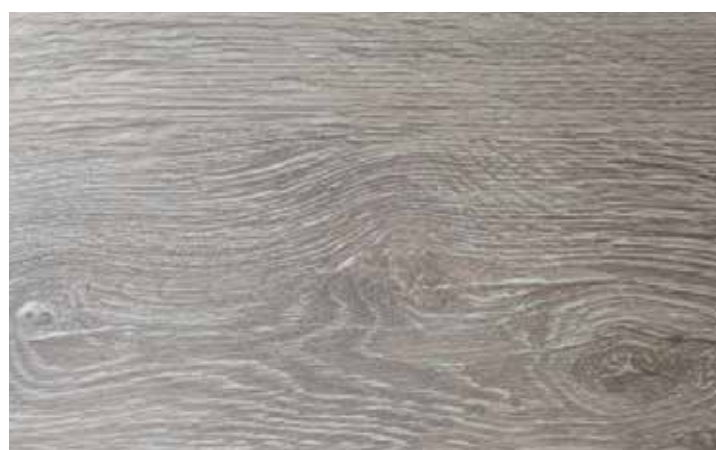
Modelo : Greige